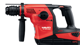
TE 30-A36 Martillo Combinado a batería