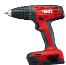
SFC 18-A Taladro atornillador a batería