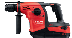
TE 30-A36 Martillo Combinado a batería