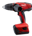
SF 22-A Atornilladora a batería