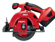
SCW 18-A Sierra circular a batería