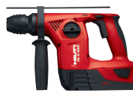
TE 4-A18 Rotomartillo a batería