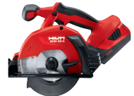
SCM 22-A Sierra circular de metal a batería