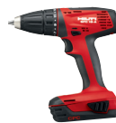
SFC 18-A Taladro atornillador a batería