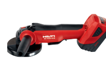
AG 500-A18 Esmeril angular a batería