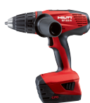
SF 18-A Atornilladora a batería