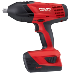
SIW 22T-A Llave de impacto a batería