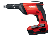
SD 4500-A18 Atornilladora a batería