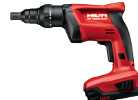
ST 1800-A18 Atornilladora a batería