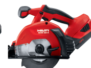
SCM 18-A Sierra circular de metal a batería