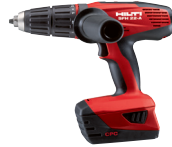
SFH 22-A Taladro atornillador a batería