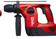
TE 4-A22 Rotomartillo a batería