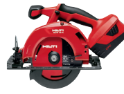
SCW 18-A Sierra circular a batería