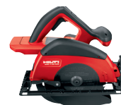
WSC 7.25-A36 Sierra circular a batería