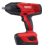
SIW 18-A Llave de impacto a batería