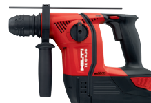
TE 6-A36 AVR Rotomartillo a batería