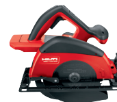
WSC 7.25-A36 Sierra circular a batería