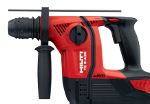
TE 6-A36 AVR Rotomartillo a batería