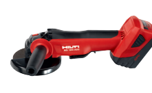
AG 125-A22 Esmeril angular a batería