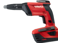
SD 5000-A22 Atornilladora a batería