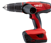
SFH 18-A Taladro atornillador a batería