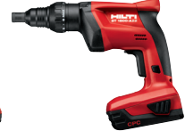
ST 1800-A22 Atornilladora a batería